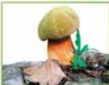
белый гриб (дубовый)