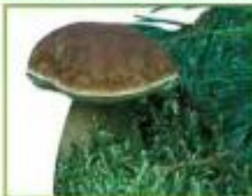
белый гриб (сосновый)