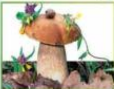
белый гриб (еловый)